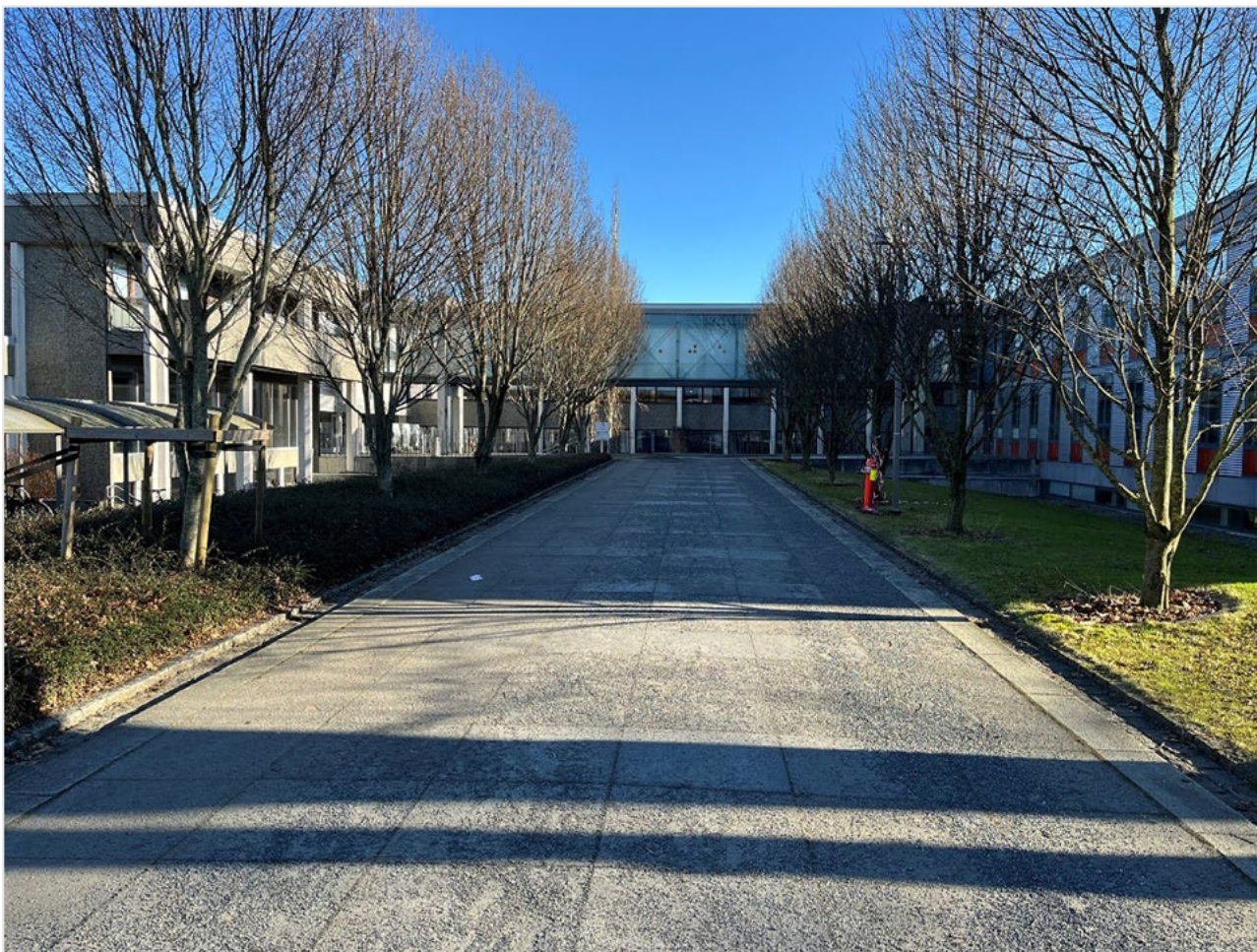
Hagbard Line-huset ved UiS.

KSU har òg finansiert delar av aktiviteten med akkumulerte midlar, jamfør brev frå KD datert 8. september 2022, ref. 18/6458-24 (deira referanse). Arbeidet er fordelt på tre område: tidsskriftet vårt (NJSR), utvikling av digitale ressursar og prosjektet «Forskning i bruk».