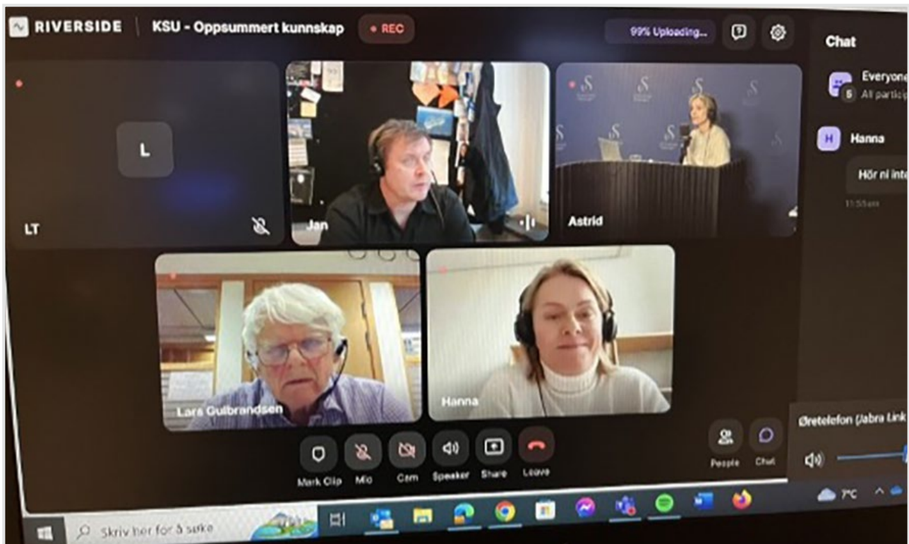
Frå innspelninga av podkasten «Barnehageforskning i Skandinavia - trender og perspektiver», der deltakarane frå Danmark, Sverige og Norge var med digitalt frå kvart sitt heimland.